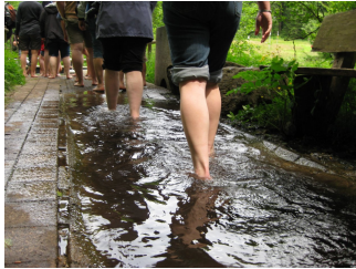
Im Barfusspfad Dornstetten Klick hier für größeres Bild

Bei einem schönen Grillfest feierte der TSV Eningen die die Meisterschaft der 1.Herrenmannschaft und dem Aufstieg in die Kreisliga und den Aufstieg der 2. Herrenmannschaft in die Kreisklasse A. Kurz nach dem Bezirkstag, konnte dabei auch schon die Zusammensetzung der neuen Spielklassen angeschaut werden. Die Aufgaben in der nächsten Saison werden schwierig aber das den Feiern bis in die Morgenstunden tat das keinen Abbruch.