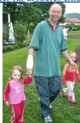
Die jüngsten TT-Läuferinnen Klick hier für größeres Bild

Trotz ungünstiger Witterung ließen sich auch in diesem Jahr einige Spieler der Tischtennis-Abteilung des TSV Eningen es sich nicht nehmen und beteiligten sich am Charity Lauf zum 10-jährigen Jubiläum der Aktion "Fußball-Kids helfen". Dabei wurde jede gelaufene Runde von den TT-Spielern mit 50 Cent Spendengeld für eine gute Sache belohnt.