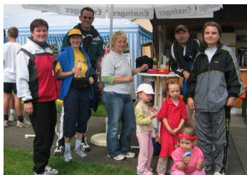
TT-Gruppe nach dem Laufen Klick hier für größeres Bild