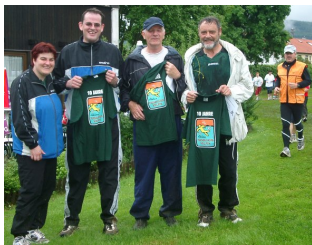
TT-Gruppe beim Charity-Lauf 2006 Klick hier für größeres Bild

Auch während der trainingsfreien Pfingstferien fanden Akteure der Tischtennis-Abteilung des TSV Eningen in diesem Jahr den Weg in die Schillerturnhalle – allerdings nicht um sich für die anstehenden Sommer - Turniere fit zu halten, sondern in einer ganz anderen Mission. Dabei zeigten die Tischtennis - Spieler, dass sie nicht nur mit Schläger und Zelluloid-Ball umgehen können sondern auch sehr gut mit Pinsel und Farbe. In Absprache mit der Gemeindeverwaltung wurde die Herrenumkleidekabine frisch gestrichen. Passend zur Jahreszeit strahlen die vier Wände jetzt wieder in frühlingshaftem, frischen Gelb, was sich sicherlich auch der Stimmung bei den Sportlern auswirken wird. Herzlichen Dank!