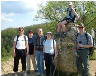
Maiwanderung 2005 Klick hier für größeres Bild