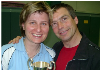
Mixed-VM 2006 Klick hier für größeres Bild