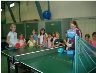
Spaß am Spiel beim Ferienprogrammangebot der TT-Abteilung Klick hier für größeres Bild