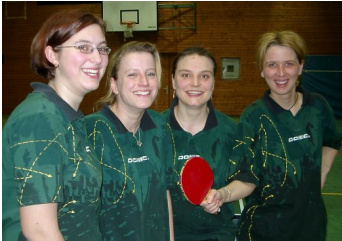
Das Meisterteam Damen 3

Die erste Damenmannschaft des TSV Eningen ist im Bezirkspokal in der nächsten Runde. Die Spielerinnen des TSV Eningen erspielten sich beim Bezirksklassenteam vom SV Weilheim einen 4:0-Sieg. Herzlichen Glückwunsch!!