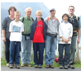
Die Eninger Reisetrippe am Walensee Klick hier für größeres Bild