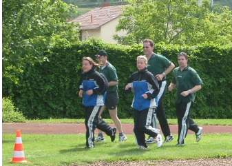
TT-Gruppe beim Charity-Lauf 2004 Klick hier für größeres Bild

Hier sind die News aus der Tischtenniswelt des TSV Eningen (Saison 2003/04).