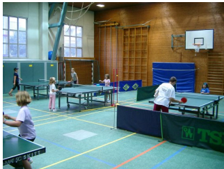
Viele Mädchen beim Ferienprogrammangebot der TT-Abteilung Klick hier für größeres Bild