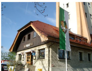
Herrlich gelegenes Ziel der Maiwanderung 2004 Klick hier für größeres Bild