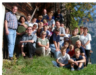
Die Eninger Reisetrippe am Walensee Klick hier für größeres Bild