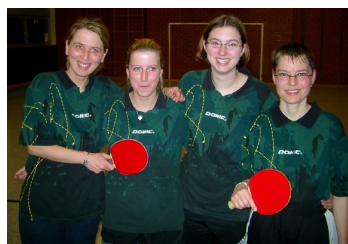
Das Meisterteam Damen 3