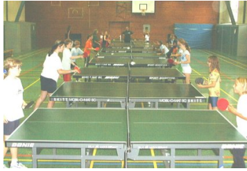
Volles Haus in der Schillersporthalle Klick hier für größeres Bild

TT-Abteilung sicher nicht das letzte Mal die Gegend besuchen wird.